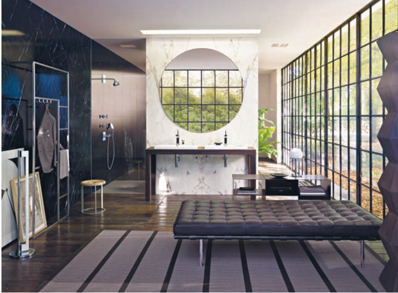
Axor Citterio, 2010