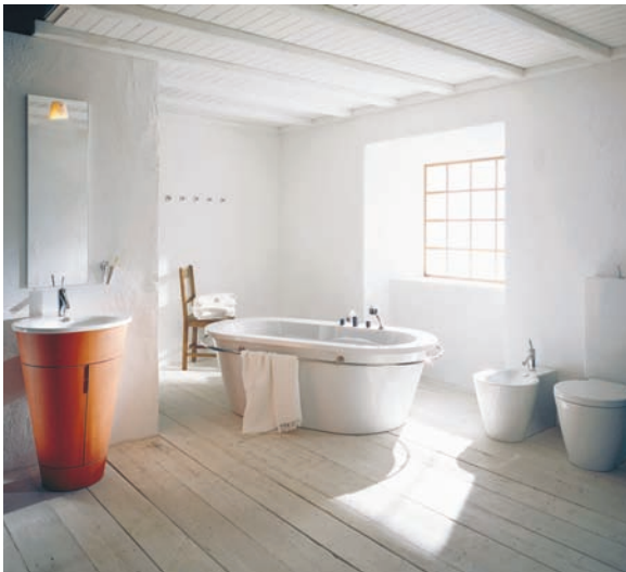
Axor Starck, 1994