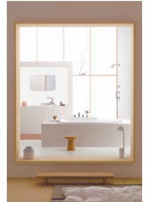
Axor Bouroullec, 2010