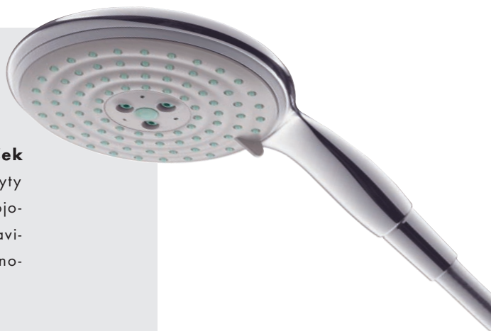
Hansgrohe Pharo sprchový altán 160

má firma Hansgrohe na svém kontě. Dva patenty jsou skryty v ruční sprše Raindance: jeden za unikátní proud od vývojového oddělení Hansgrohe a druhý za poměr velikostí hlavičky a držadla, na jehož základě vytvořil Phoenix Design nový archetyp sprchy.