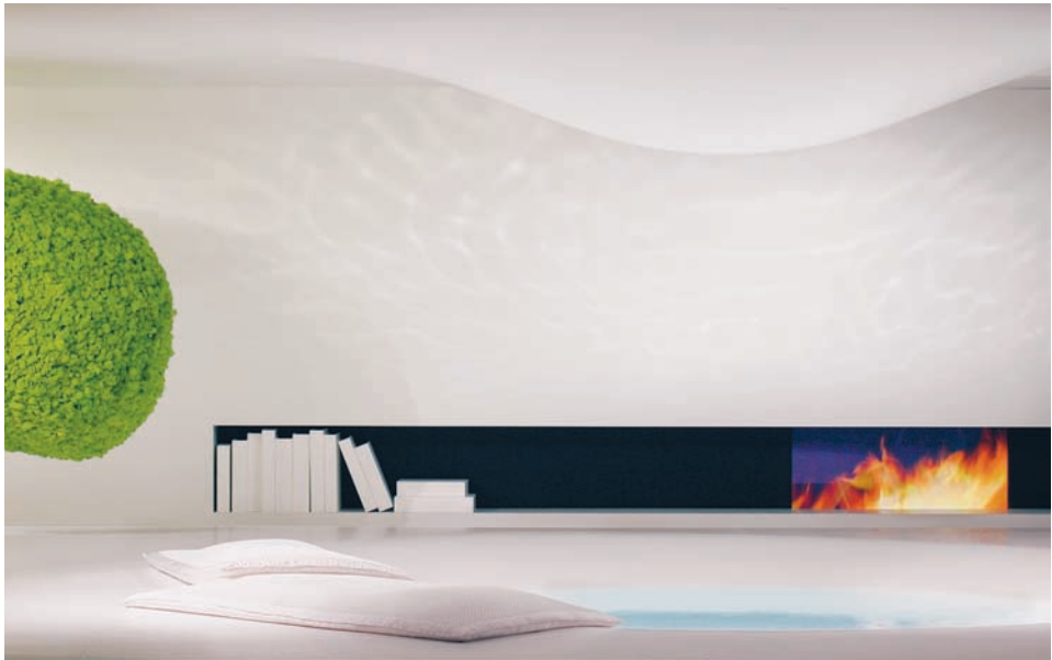
Axor WaterDream 2005 od Jean-Marie Massaud