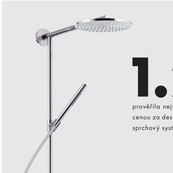
Hansgrohe Raindance Connect EcoSmart